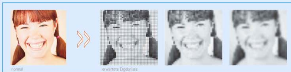
Maximal mögliche räumliche Auflösung durch den Einsatz des retinalen Implantats

Das Implantat kommt exakt an der Stelle der Netzhaut zu liegen, an dem sich bei gesunden Menschen die lichtempfindlichen Sinneszellen befinden. Dadurch ist gewährleistet, dass die vom Implantat abgegebenen elektrischen Ladungen tatsächlich auf die gleichen Nervenzellen der Netzhaut übertragen werden, die bei Menschen mit intakter Netzhaut Informationen von den Photorezeptoren erhalten. Somit wird das Informationsverarbeitungsnetzwerk der Netzhaut auf natürlichem Wege genutzt.