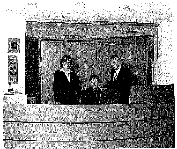
Der abgerundete Empfangsbereich strahlt eine harmonische Atmosphäre aus.