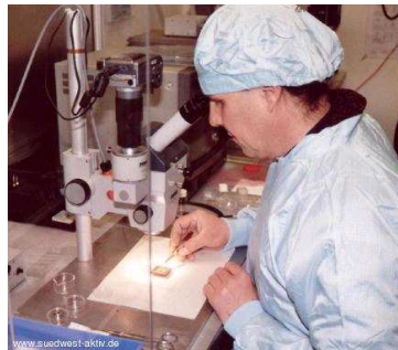
Ein Mitarbeiter der Reutlinger Retina Implant montiert in einem Reinraumlabor unter dem Mikroskop einen Seh-Chip.

Mit einem Seh-Chip macht das Reutlinger Unternehmen Retina Implant blinden Menschen Hoffnung, einen Teil des Sehvermögens wiederzuerlangen. Die im Südwesten entwickelte Prothese überzeugt auch einen US-Investor, der in die Finanzierung der jungen Firma einsteigt.