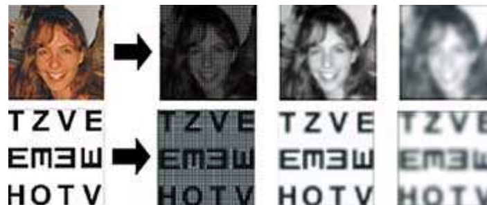
Originalabbildung (links) sowie drei simulierte Seheindrücke mit dem Chip mit unterschiedlicher Spannungsvorgabe: Je höher die Intensität, um so mehr verschwimmt das Bild.

TÜBINGEN (ars). Nach jahrelanger Blindheit wieder Licht wahrnehmen, sich frei in einem unbekanntem Raum bewegen - diese Vision könnte demnächst für einige Menschen Wirklichkeit werden. Denn noch in diesem Jahr will ein Verbund von Forschergruppen den ersten Patienten einen Mikrochip hinter die Netzhaut setzen, der Lichtreize in elektrische Impulse für Nervenzellen umwandelt.